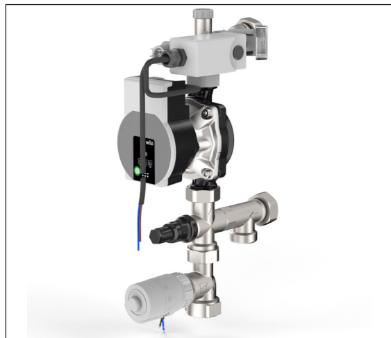
Рис. 1-2 Комплект регулирования Flex с сервоприводом