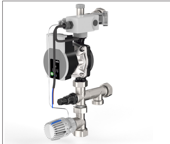
Рис. 1-1 Комплект регулирования Flex с термостатической головкой