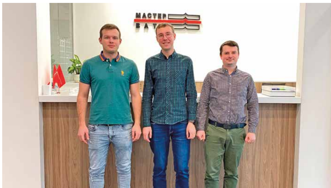
• Команда «Омега», Москва